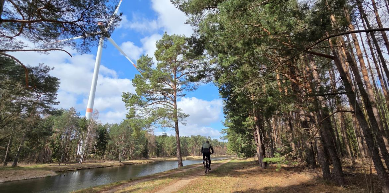
Der Uferweg folgt dem Oder-Spree-Kanal fast bis nach Berlin