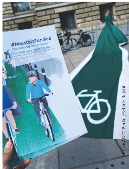
Der ADFC Berlin bringt den Forderungskatalog zum Abgeordnetenhaus