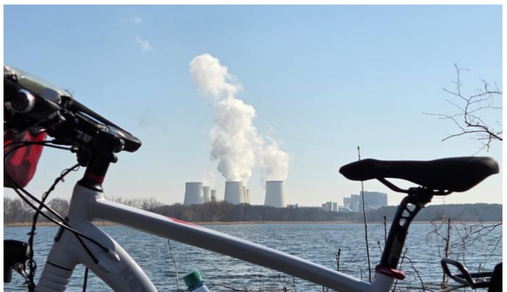
Das Braunkohlekraftwerk Jänschwalde versorgt Cottbus mit Fernwärme

Das Bäckereicafé am Marktplatz von Peitz ist der letzte Verpflegungsstopp vor einer langen Durststrecke: Nachdem wir in Preilack die Landstraße verlassen haben, biegen wir auf den Heideradweg ein, der seit 2023 auf einer stillgelegten Bahntrasse durch die Lieberoser Heide führt. 23 schnurgerade Kilometer auf Premium-Asphalt durchs Wolfsrevier! Und mittendrin die größte Wüste Deutschlands. Die entstand durch einen Waldbrand 1942, nach dem zunächst die