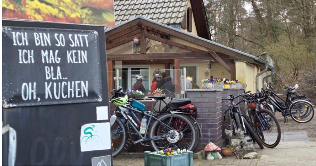
Hollys Café in Hartmannsdorf am Spree-Radweg ist immer gut besucht

nächste 1A-Radweg kreuzt. Der Lückenschluss sei nicht geplant, teilt der Landkreis LOS mit Verweis auf die passable Alternative mit. Die Straße ist angenehm zu fahren bis nach Krügersdorf, wo Brandenburgs dickste Eichen stehen. Ein Schild meldet 10,22 Meter Stammumfang anno 2014.