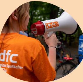
AG Kinder & Familien