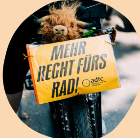
AG Demonstrationen & Aktionen